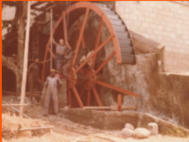
Ruota Mulino Murhesa

Ha iniziato la sua attività realizzando, con altri volontari di AMG, un mulino, divulgando la coltivazione della soia, utile al recupero dei bambini Bwakii (malnutriti).