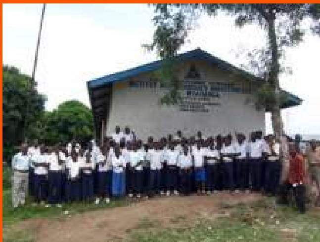
Scuola ITIN Rutshuru