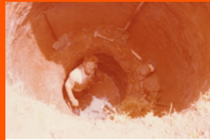
Scavo pozzo per dispensario sull'isola di Ibinja

Aveva poi esteso il suo intervento nel settore sanitario costruendo dispensari e incanalando sorgenti, portando l'acqua potabile nei villaggi da sempre colpiti da epidemie di colera e da altre infezioni.