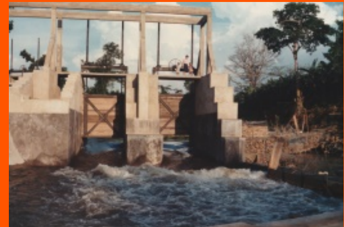
Sbarramento centrale Rutshuru

Con altri volontari di AMG ha realizzato una centrale elettrica di 600 Kw che alimenta parzialmente la città di Rutshuru, incluso un ospedale da 200 posti letto, scuole, dispensari, artigiani, conservazione del pesce.