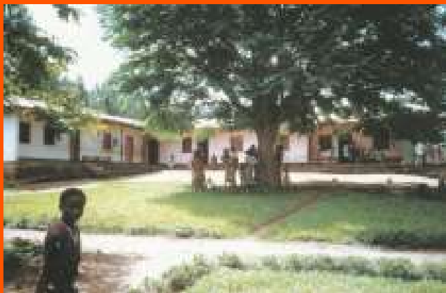
Dispensario e Maternità di Rubare