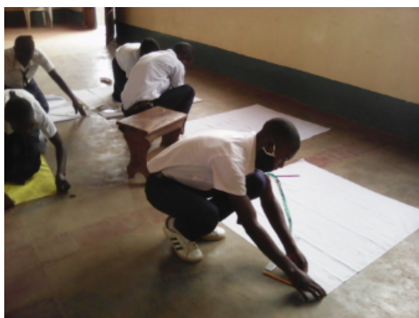
Taglio e cucito